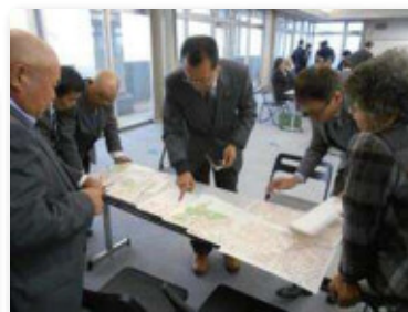
パトロール実施後の会議の様子(昨年)