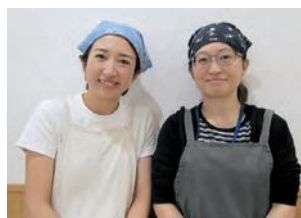
（左）吉富管理栄養士、（右）佐々木管理栄養士

本庄市と台湾台南市が友好交流協定を結んだことにちなんで、台湾グルメを紹介します。