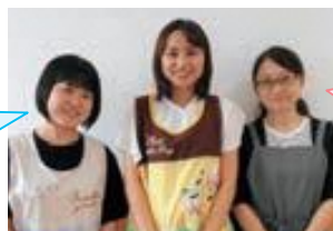
(左から)日向・橋場・栗田 管理栄養士

里芋に含まれるカリウムは、高血圧予防に効果的！ぬめり成分には、免疫力を高める効果があります。