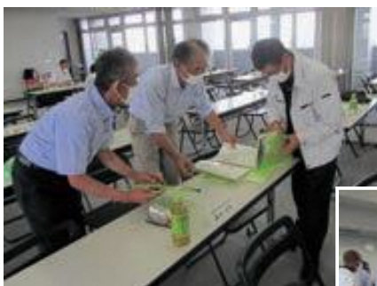
農地パトロールの打ち合わせ

※ご自身で耕作できない場合は、農業委員会で借り手や買い手をあつせんしますので、お近くの農業委員や農地利用最適化推進委員、または農業委員会事務局（市役所4階）にご相談ください。