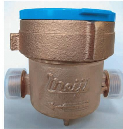
口径13mmの水道メーター(本庄地区の仕様)