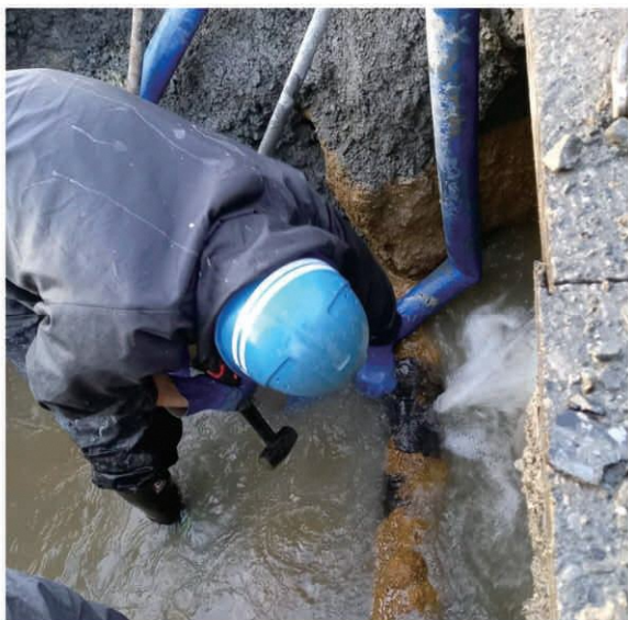
水道管を修繕している状況