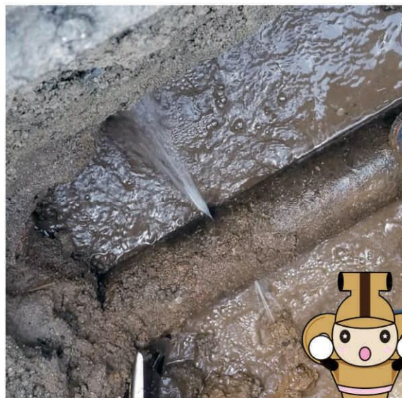
水道管から漏水している状況

長年使用している水道管は、老朽化により、ひび割れによる水漏れやひどい場合には水道管が破裂するような事故が起きてしまうことがあります。漏水事故が発生すると修繕のために一時断水を行う場合があり、工事中は利用者の皆様にご迷惑とご不便をおかけしますが、ご理解とご協力をお願いします。