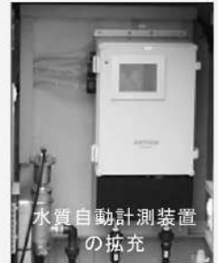
水質自動計測装置の拡充