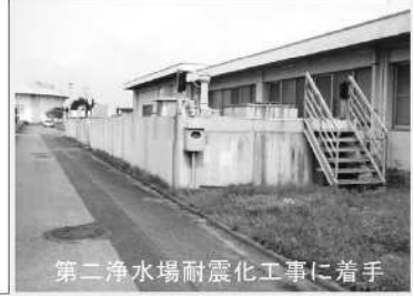
第二浄水場耐震化工事に着手