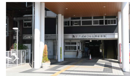
▲本庄駅南口自転車駐車場