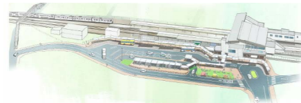
▲本庄駅北口駅前広場イメージ