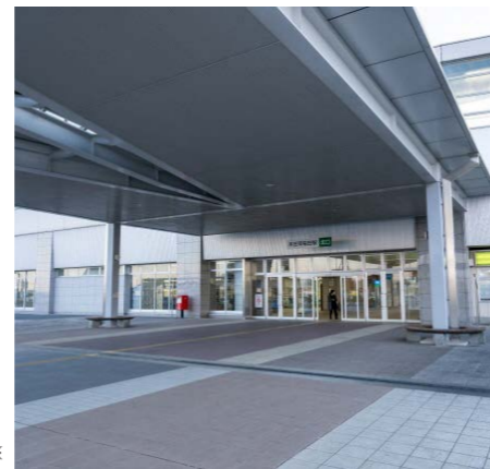
▲本庄早稲田駅北口