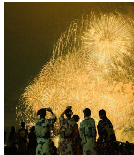
▲令和6年に行われた利根川花火大会