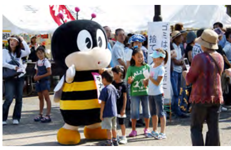
生涯学習のマスコット“マナビ”もふれ愛夏祭の会場でPR!

この秋、生涯学習の国民的祭典である第21回全国生涯学習フェスティバル「まなびピア埼玉2009」が開催されます。生涯学習見本市や生涯学習体験広場、記念事業の開催など楽しいイベントがたくさんあります。