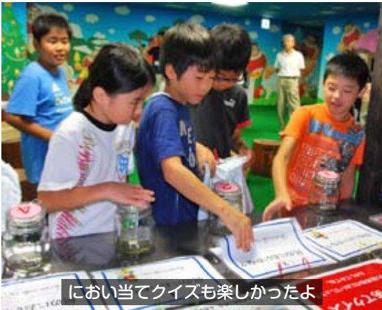
におい当てクイズも楽しかったよ

学習会では、児玉町小平の小平川で水生生物調査を行い、サワガニやゲンゴロウなどの生息を確認しました。午後は、児玉町児玉にある赤城乳業(株)本庄千本さくら『5S』工場へ行き、アイスクリームの生産工程を工場見学を通じて学ぶことができました。