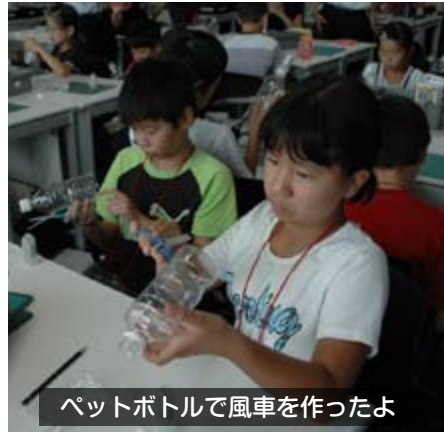
ペットボトルで風車を作ったよ

これは、埼玉県の「元気な地域を創造する子ども大学推進事業」により実施されるもので、来年の3月まで全7回にわたって授業が行われます。第1回では「風力発電機をつくろう！」をテーマにして、電気はどのようにして作られるのかを学びました。