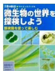
微生物の世界を探索しよう 阿達直樹 著