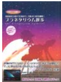
プラネタリアム 散歩 マールブックス 編