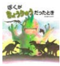
ぼくがきょうりゅうだったとき まつおかたつひで 作・絵