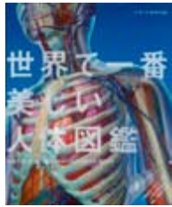
世界で一番美しい人体図鑑 監訳 奈良