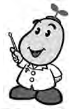
国保マスコット 健康まもるくん