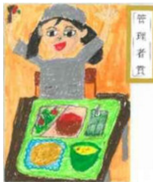
平成29年度 管理者賞作品