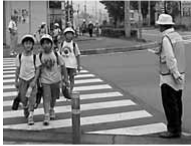
子どもたちの安全を見守っています

市内では、各自治会・学校PTA・有志団体が子どもの登下校時の見守り活動や、防犯パトロールを行い、地域の安全・安心のまちづくりのために活躍しています。犯罪から地域を守るために、みなさんのご協力が必要です。