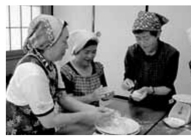
9/26 手作りまんじゅう教室 (本庄東公)