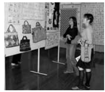
10/20・21 本庄西公民館クラブ活動発表会