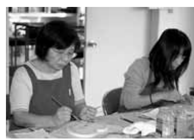
10/10 トールペイント教室 (北泉公)