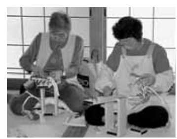
10/11 布ぞうり教室(仁手公)