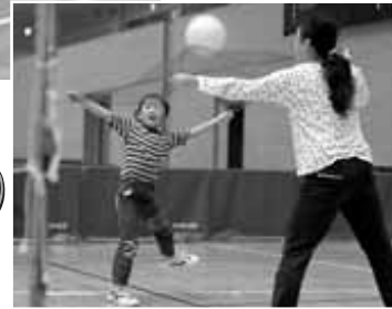
ネット・ネットゲーム