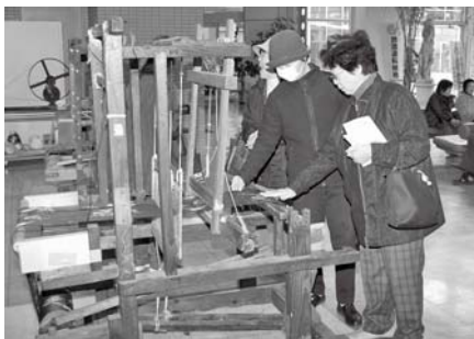
ほんじょうがすり

市の地場産業である本庄緋 ほんじょうがすり の展示・実演を行います。はた織りの体験もできますので、みなさんお誘い合わせのうえ、お出かけください。