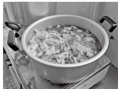
ご家庭でも「つみっこ」を作ってみてはいかがでしょうか？

会場 市役所中庭(市民ホール奥) 料金 一杯100円(各日先着約100人。なくなり次第終了します)