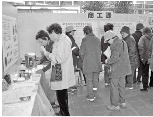
昨年のくらしイキイキ生活展の様子