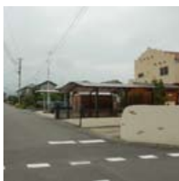
▲児玉南土地区画整理事業地内