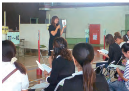
基金で作成した「親の学習手引書」を活用した学習風景