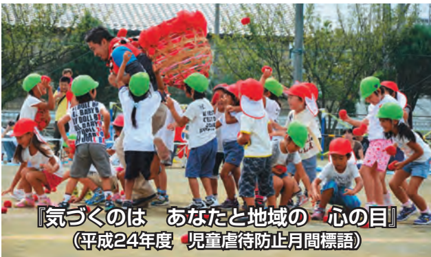
『気づくのは あなたと地域の 心の目』 (平成24年度 児童虐待防止月間標語)

親や養育者が、子どもの心や体を傷つけ、健やかな成長や人格の形成に重大な影響を与える行為をいいます。「しつけ」と思っている行為でも、現実に子どもの心や体を傷つける行為であれば、それは虐待です。親の立場よりも、子どもの立場で判断することが大切です。具体的には次の4つのタイプがあります。