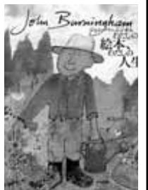
わたしの絵本、私の人生 ジョン・バーニンガム 著