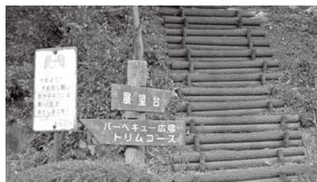
ふるさとの森公園

若泉運動公園のせせらぎ広場は水遊びができる公園として、子どもたちにとっても人気があります。