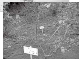
アジサイの苗には植えた人のメッセージ板が…

今年の10月、せせらぎ広場西側の段丘斜面に、ボランティアのみなさんがアジサイを約300株植えました。6月から7月にかけて咲くので、散歩コースに最適。花の季節をお楽しみに…。