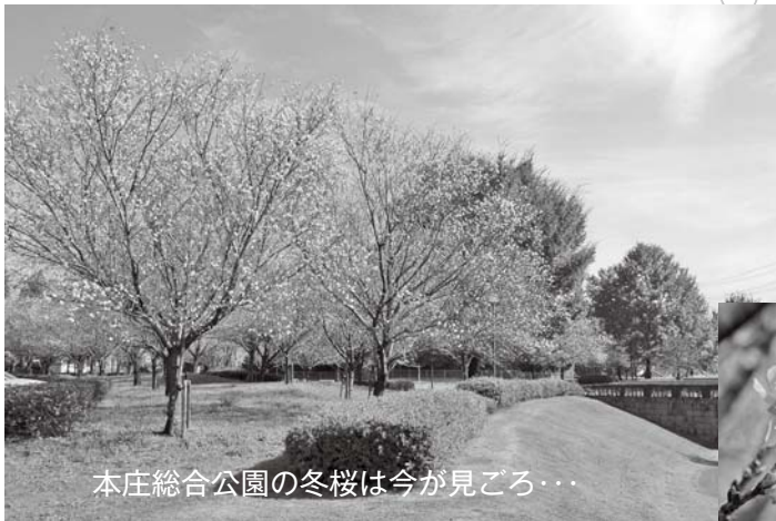
本庄総合公園の冬桜は今が見ごろ...