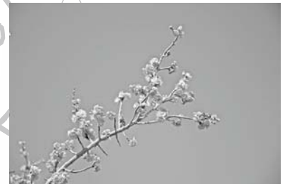
2月には梅がほころびます

本庄総合公園には約20本の冬桜があります。冬桜は花びらが白や薄紅色で、11月中旬から12月初旬にかけて見ごろとなります。また、約200本の梅の木があります。梅の花が咲けばいよいよ春の到来です。梅の花を觀賞しながら、春の訪れを感じることができるでしょう。