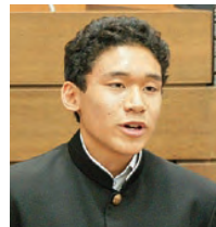
金見 一也 議員 本庄西中学校

公共施設では、市役所庁舎、シルクドーム、エコーピア、セルディ等は新耐震基準によって建てられています。また、市民文化会館及び勤労青少年ホームについては、耐震改修工事が実施済みとなっています。一方、総合支所など旧耐震基準により建てられた施設の多くは、市民が日ごろ利用する施設であり、避難場所でもあります。今後は、古い施設を統合して新しくしたり、施設そのものを廃止したりと、総合的に検討する中で、耐震化を計画的に進めていきたいと考えています。