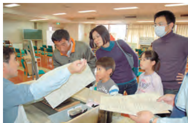
群書類従の版木をすってみました。