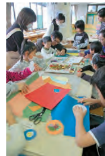
オリジナル しおりを作っ たよ。