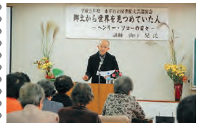
文芸講演会も聴きました。