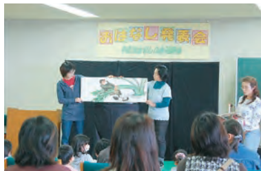
おはなし発表会を見てきました。