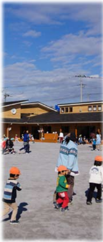
いずみ保育所・発達教育支援センター「すきっぴ」(平成22年3月竣工)