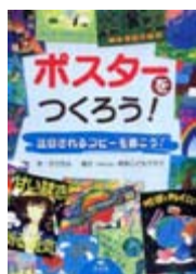
ポスターをつくろう! デジカル 作