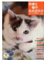
作家と猫のものがたり yomyom 編集部編