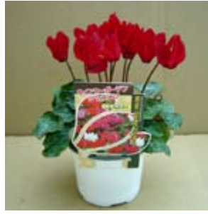
ガーデンシクラメン