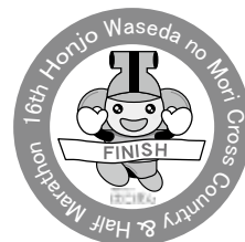
第16回大会ロゴマーク

申込期間 12月12日(月)～1月29日(日) (郵便払込取扱票での申し込みは、1月13日(金)まで)