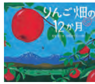
りんご畑の12か月 文 松本 猛