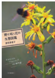
花の鑑 咲く野に 多田 多患 著