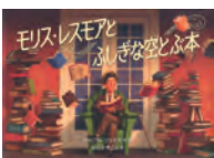
モリス・レスモアと ふしぎな空とふし ウィリアム・ ジョイス 作・絵