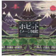
トルキンのホビット イメージ・G・ウェイン ハモンド 著