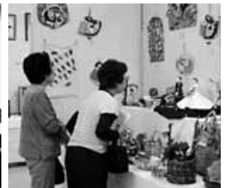
10/28北泉公民館クラブ活動発表会