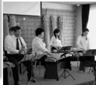
11/18南公民館クラブ活動発表会