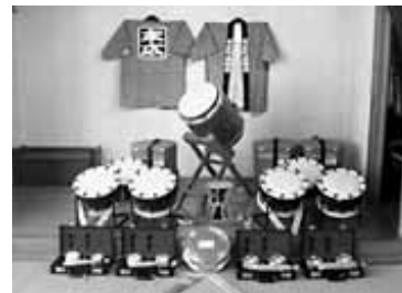
祭り囃子道具一式 (末広町)

財団法人自治総合センターが実施している平成18年度宝くじ助成を受けて、連雀町自治会では大人御輿を、末広町自治会では祭り囃子道具一式をそれぞれ購入しました。