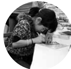
11/4児玉文化祭合同展(きり絵体験)