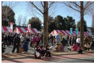
▲昨年のつみっこ合戦の様子