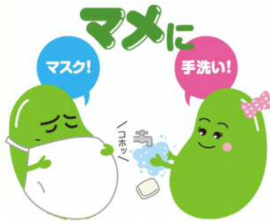
インフルエンザ予防啓発キャラクター マメウくん アスキちゃん

手洗いでインフルエンザを予防して、かかったらマスクなどでせきのエチケットも忘れないでください。