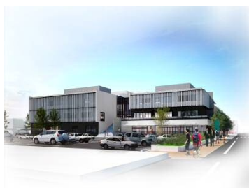
▲はにぼんプラザ外観イメージ