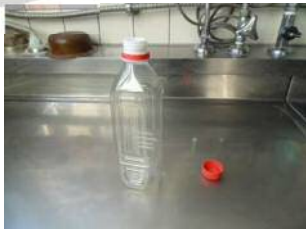
①空のペットボトルを用意し、冷ました廃食用油を入れる。