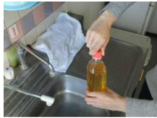
②廃食用油が漏れないように必ずキャップを閉める。