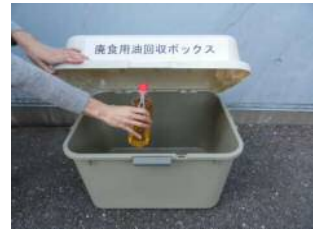
③回収場所にある回収ボックスに入れて排出。

●回収場所 アスピアこだま、セルディ、公民館（本庄、本庄東、本庄西、本庄南、藤田、仁手、旭、北泉、共和） ※アスピアこだま、セルディ、本庄公民館、共和公民館でも回収を始めます。