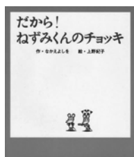
だから! ねずみくんのチョコッキ 上野紀子 絵