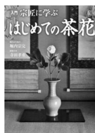
入門宗匠に学ぶ はじめての茶花 堀内宗完 著