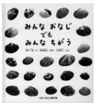
みんなおなじでもみんなちがう 奥井満文 著