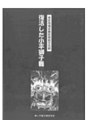
舞獅子保存会 小獅子舞復活 東編