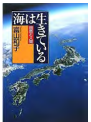
海は生きている 富山和子著