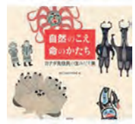
命のかたち 住友信子著 美奈子 編 国立民族学博物館