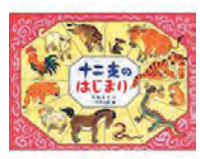
十二支のはじまり 二侯英五郎画