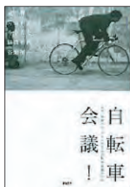
自転車会議! 片山智博著 右京 昭博 ほか著