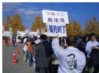
▲加須市で行われたB級グルメ大会でも完売。40団体中で6位と大健闘でした。

このすいとんを本庄では「つみっこ」と呼んでいます。これは養蚕の仕事である桑の葉を摘み取る様と、具の小麦粉を練って手で摘み取るようにちぎって鍋に入れる動作が似ていることに由来すると言われています。 現在、市内の13店で、それぞれ工夫をこらした特徴のある「つみっこ」が味わえますが、今年の8月に、商売の一部としてではなく、「つみっこ」を内外にPRしたいという熱意あふれる市民のみな