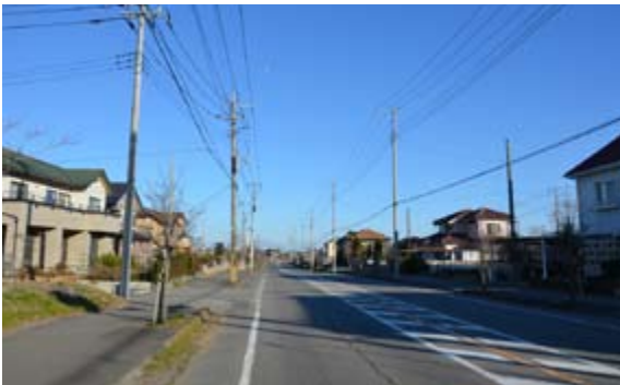
▲第7次住居表示整備事業地域