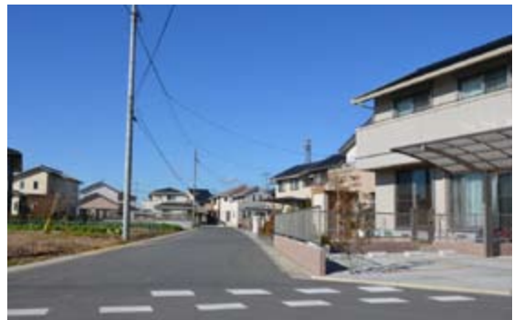
▲第8次住居表示整備事業地域