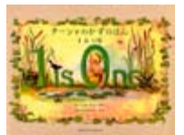
ターシャのかずのほん ターシャ・テューダー 著