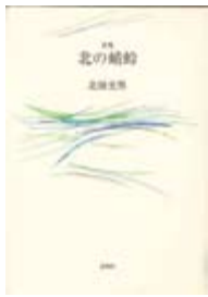
詩集 北の蜻蛉 北畑光男著