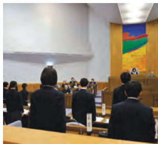
▲昨年のまちづくり議会