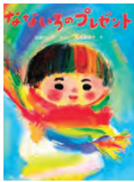
なないろのプレゼント 石津 ちひろ 作