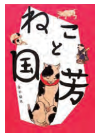
ねこと国 芳川 久信 著 金子 久子 著