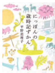
にっぽんの歳時記ずかん 平野 理恵子 著