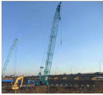
▲建設中の国道17号本庄道路の様子

日程 2月25日(火)～3月5日(水)(土・日を除く) 会場 市役所1階市民ホール