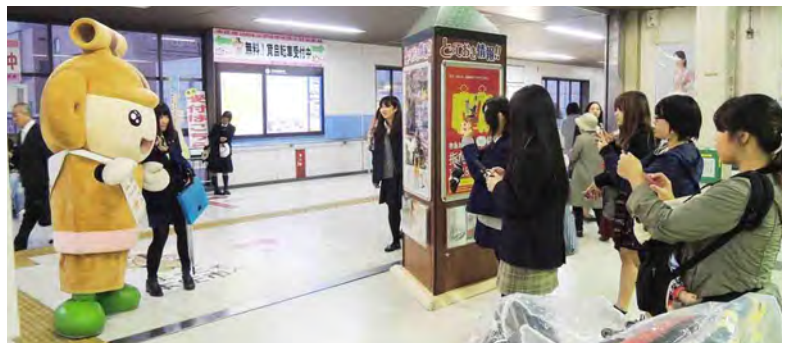
▲JR本庄駅での選挙活動（昨年）

はにぼんの順位は、2012年に226位、2013年に148位でした。はにぼんが日本一になれば、本庄を全国にPRする機会が増えます。また、グッズの販売数も増え、さらなる経済効果も望めます。本庄を全国にPRし、地域を盛り上げていくためにも、みなさんの協力が不可欠です。“清きワンクリック”をお願いします。（投票方法は30ページ裏表紙をご覧ください）