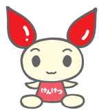
献血キャラクター「けんけつちゃん」