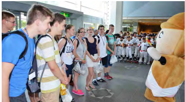
▲市役所でお出迎え

7月25日にドイツヘッセン州から来日したスポーツ少年団一行12人をはにぼんと市内スポーツ少年団のみなさんが歓迎しました。ドイツスポーツ少年団は31日までの間、本庄市にホームステイし、滞在中は、武道館での剣道や宍勝寺での座禅、早稲田大学本庄高等学院の生徒とのディスカッションなど盛りだくさんの内容で、日本のスポーツや文化を体験しました。