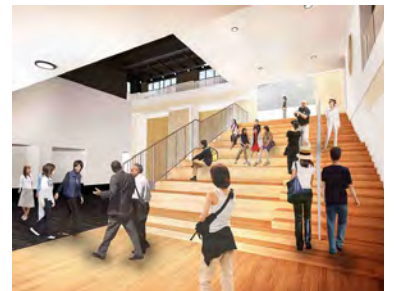
▲屋内大階段と展示ホールのイメージ