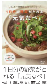
1日分の野菜がとれる「元気なべ」 堀人美・牧野直子 著