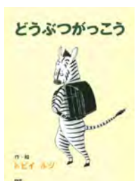
どうぶつがっこう トビイ ルツ 作・絵