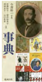
『坊っちゃん』 今西幹一 企画