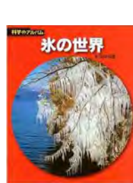
氷の世界 東海林明雄 著