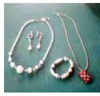
ピアス、 ネックレス、 ブレスレット