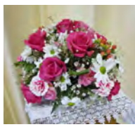
フワアアレンジメント