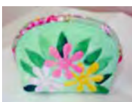
ティアレのポーチ