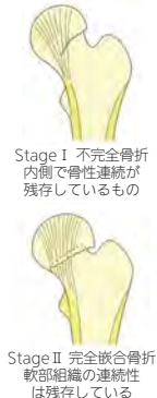
Stage I 不完全骨折 内側で骨性連続性が残存しているもの

頸部の骨折 B ずれが無い又は少ない場合(Stage I又はII)固定具を用いて骨折部を固定します(骨接合術)。