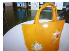
花柄トートバック