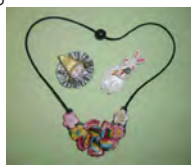
ネックレス、ブローチ