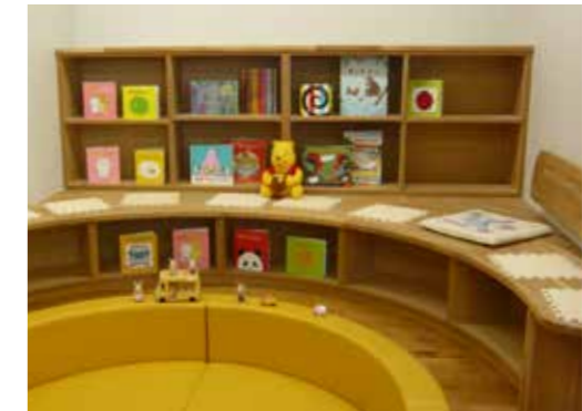
児玉児童センターの図書室

投稿総数212通のうち匿名のものや回答を希望しないもの、担当部局が対応し、回答不要となったものなどを除く70通について文書で回答しました。うち同意があったもの51件は市ホームページで公開しました。