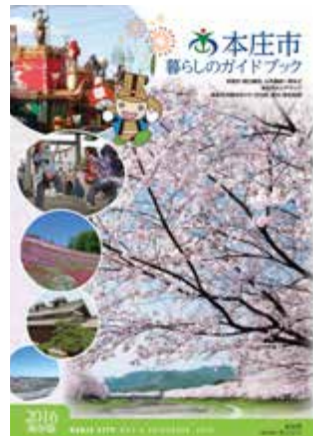
くらしのガイドブック イメージ

★広告に関する問い合わせ (株)ゼンリン 大宮営業部 ☎0481642149 46