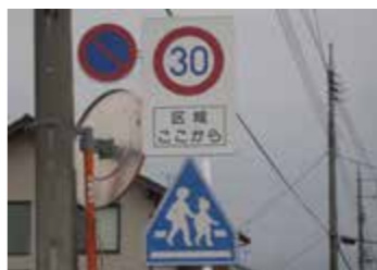
ゾーン30の標示・標識イメージ