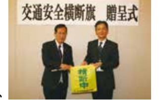
交通安全横断旗 贈呈式