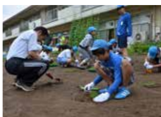
芝生の苗を植える本庄東小学校の子どもたち

6月28日、市内で7校目となる芝生苗の植え付けが行われました。グラウンドの芝生化には、運動時の怪我を減らす、日光の照り返しを抑える、土ぼこりが立たなくなるなど、さまざまな効果が期待されます。