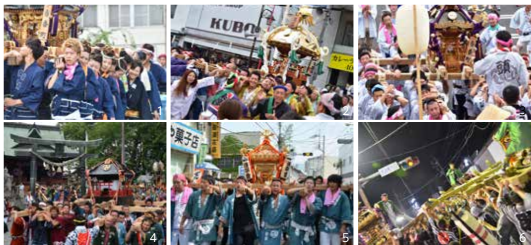
(本庄祇園まつり) 1. 2. 3総勢21基のみこしが本庄市街を練り歩く／(こだま夏まつり) 4八幡神社の境内から宮みこしが出発／59基のみこしが市街地を渡御／6激しくぶつかり合うケンカみこし

17日のこだま夏まつりでは、みこし同士が激しくぶつかり合う「ケンカみこし」が行われ、多くの見物客を魅了しました。