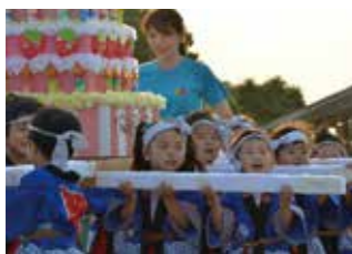
わっしょいわっしょいと元氣よくみこしを担ぐ子どもたち

7月7日、いずみ保育所で夕涼み会が開催されました。子どもたちは、みんなで作ったみこしを担いだり、山車を引いたりして祭りを盛り上げました。