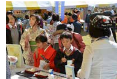
ハロウィン仮装パレードも行われ、思い思いの仮装をした子どもたちも、地元農産物や食品を楽しんだ。

10月15日、早稲田リサーチパークで実施された食と農のフェスティバル。地産地消と地元野菜の安全性啓発をコンセプトに、農産物や飲食物の販売、地元ブランド牛の試食などさまざまな催しが行われ、会場は大人から子どもまで、多くの参加者でにぎわいました。