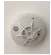
あなたの命と財産を守る 住宅用火災警報器