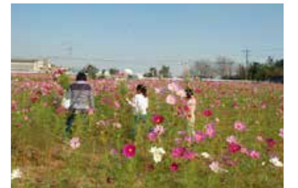
コスモスは子どもの背丈ほどの高さまで成長し、色とりどりの花を咲かせた。写真はコスモスの摘み取りの様子。

当日は見頃を迎えたコスモスが一面に咲き誇りました。また、民謡、日舞などの披露や、農産物の販売、コスモスの摘み取りなどさまざまなイベントが行われ、多くの来場者を楽しませました。