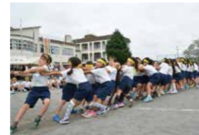
1年生から6年生まで参加し、色別対抗で実施された得点種目の「つなひき」。必死の綱の引き合いをみせてくれた。

9月24日から10月2日にかけて、市内小学校で運動会が開催されました。写真は本庄東小学校運動会の様子です。今年度のスローガンは「輝け 東っ子! みなぎるパワーで 勝利をつかめ!!」。児童たちは自分のチームの勝利を信じ、白熱した競技を展開していました。