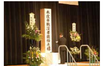
写真は市長による追悼の辞の様子。当日は約180人が訪れ、参加者全員による献花が行われた。

追悼式では、ご遺族をはじめ関係者による追悼の辞、献花など、戦没者に哀悼の意を捧げるとともに、恒久平和への祈念を行いました。