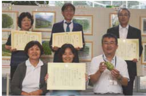
入賞者のみなさん