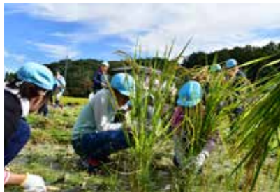
5年生たちが力を合わせて取り組んだことで、田んぼ一面に実った稲穂はあっという間に収穫された。