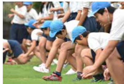
先生の合図と同時に芝生に足を踏み入れる6年生たち。自分たちで植えた芝の成長を嬉しそうに見つめていた。

当日は午前中に小雨が降ったものの、子どもたちは芝生の上を走り回って芝の感触を楽しみ、生え揃った芝生に寝転んで、その成長を背中に感じていました。