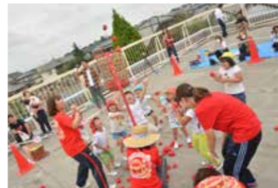
昨年の運動会は雨天により金屋小学校体育館で行われたが、最後の運動会は無事金屋保育所で実施することができた。

金屋保育所を卒園した小学生たちも競技に参加し、お世話になった保育所で最後の運動会を楽しみました。