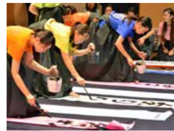
あなたの命と財産を守る 住宅用火災警報器