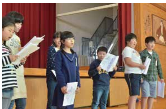
▲塙保己一の生家が学校区にある金屋小学校での練習風景。子どもたちは和気あいあいとしながらも、真剣に元氣よくセリフを読み上げた。

年会費 個人会員 一口 1,000円 賛助会員 一口 10,000円 受付場所 セルディ、生涯学習課(市役所4階)、 児玉公民館(アスパアこだま内) ★総検校塙保己一先生遺徳顕彰会事務局(セルディ内) ☎028851