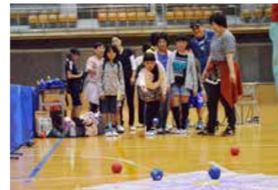
今年のリオパラリンピックでも話題となった「ポッチャ」。なかなか体験できないスポーツに、子どもたちは盛り上がった。

体育の日に合わせて、「みる・する・楽しむ」をキャッチフレーズに、スポーツやレクリエーションを楽しむこのイベント。当日は7,700人程の参加者が、さまざまな競技やレクリエーションを通してスポーツの秋を満喫しました。