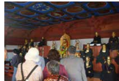
71年ぶりに御開帳となった山門の2階には、釈迦牟尼仏と十六羅漢像が鎮座している。山門は1702年の建築で、同院最古の建造物。

本庄市の文化財にも指定されている安養院で、羅漢様が10月15日に御開帳されました。今回の御開帳は戦後以来初で71年ぶり。貴重な機会とあって、市内外から多くの来場者が集まり、安養院の本堂・山門・総門の歴史を感じさせる佇まいを楽しみました。