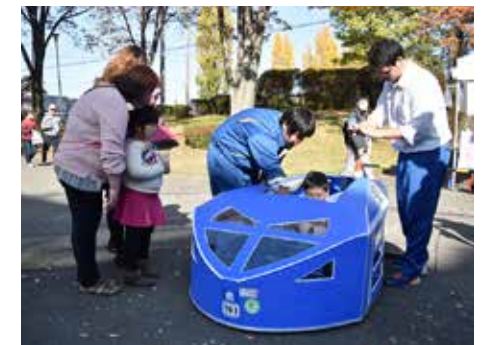
11月13日の文化祭で披露された車。心地よい排気音が校内に響く

1リットルのガソリンでどこまで走れるか。中学生から社会人までが参加し、燃費の良さを競うこの大会。児玉白楊高校機械研究部では、ボディを軽量化し、空気抵抗を少なくするなどの試行錯誤を繰り返し、「プラスチック段ボール」製のボディを生み出しました。曲面を形成するのが難しい素材のため、部員みんなで知恵を出し合い、さまざまな工夫を重ねて青色に輝くマシンが完成。燃費記録では入賞を逃したものの、斬新なフォルムや素材、カラーリングが361チームの中で最も高く評価され、「デザイン賞」で日本一となりました。