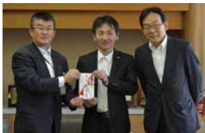
赤城乳業株式会社様

「はんじょう緑の基金」に、寄附をいただきました。いただいた寄附金は、本庄段丘斜面林など自然環境の保全・創出に対し有効に活用させていただきます。